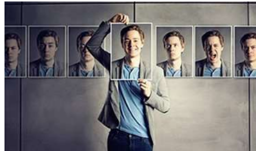
Ваш емоційний інтелект