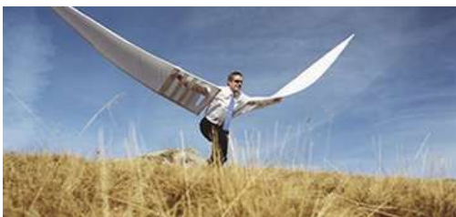
Схильність до підприємницької діяльності