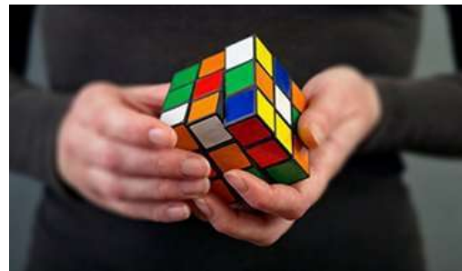
Здатність до логічного мислення