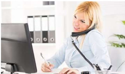
Комунікативні та організаторські здібності