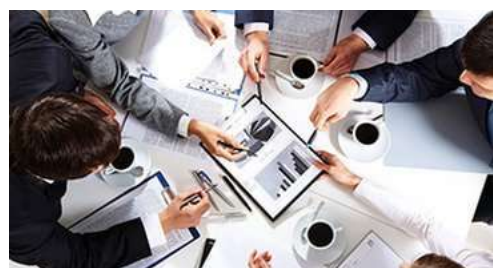
Здатність до командної роботи