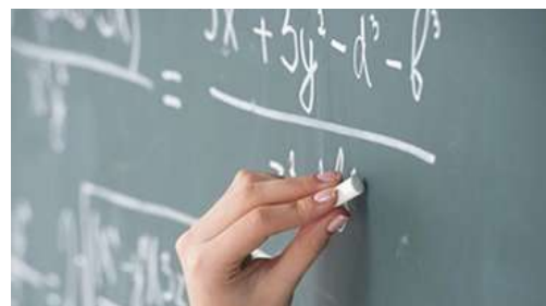
Загальні розумові здібності