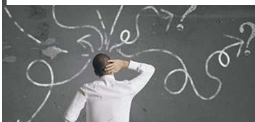
Яка сфера діяльності Вам підходить