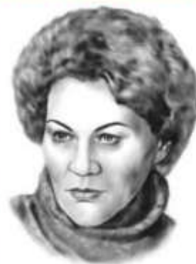
Ліна Костенко (нар. 1930 р.)