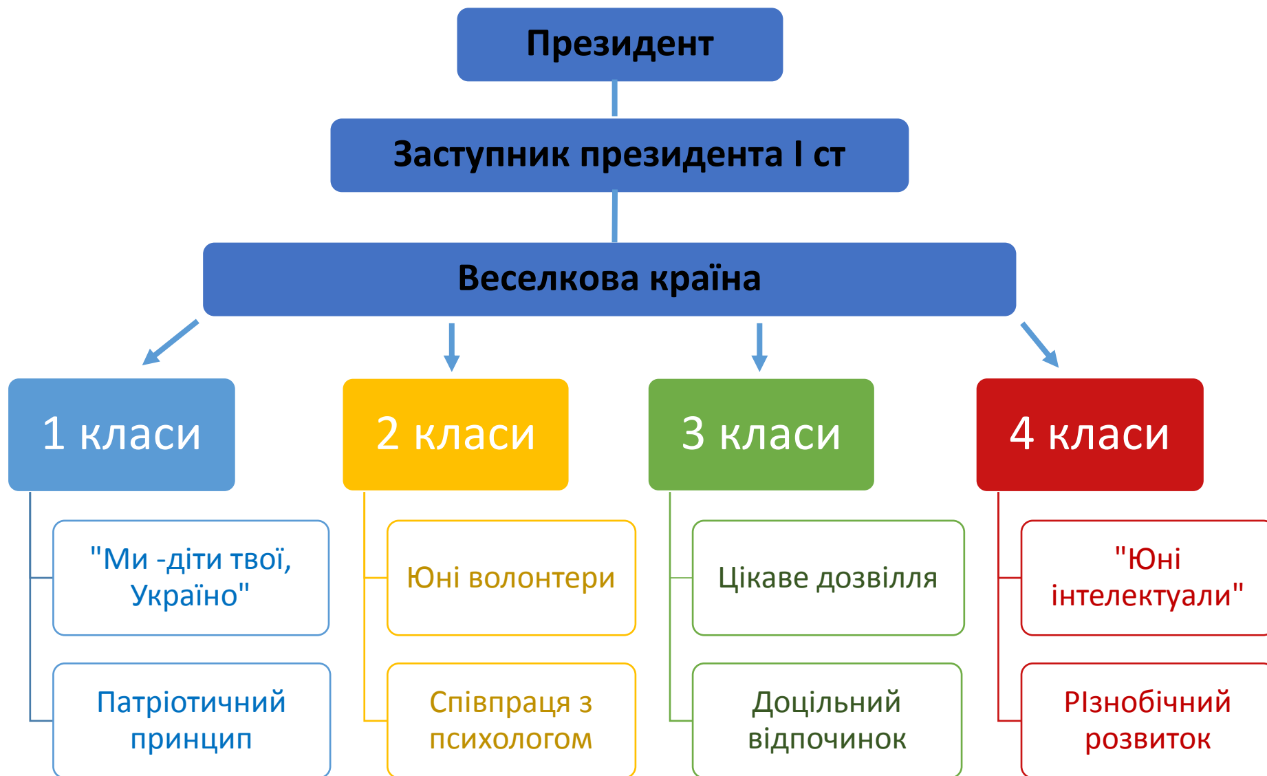
Схема учнівського самоврядування в початковій школі